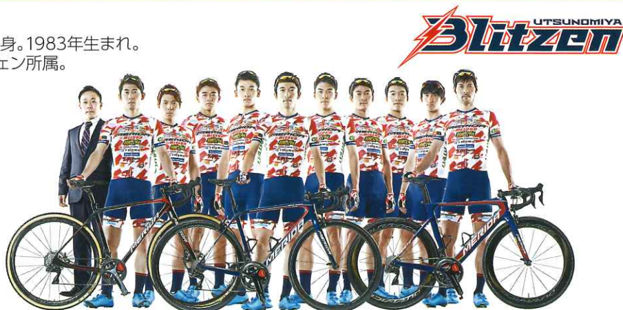
栃木県宇都宮市を拠点とする地域密着型プロ自転車ロードレースチーム「宇都宮ブリッツェン」