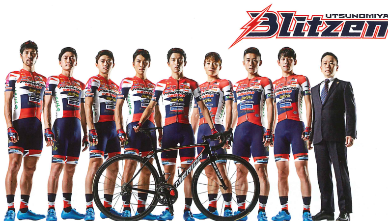
栃木県宇都宮市を拠点とする地域密着型プロ自転車ロードレースチーム「宇都宮ブリッツェン」

〈プロフィール〉 栃木県宇都宮市出身。 1992年生まれ。 宇都宮ブリッツェン所属。